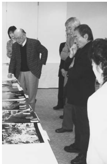
写真コンテストの審査風景